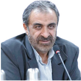
استادان چهارمحال و بختیاری: طرح توسعه کوهرنگ گام بلندی برای محرومیت‌زدایی از چهارمحال و بختیاری است