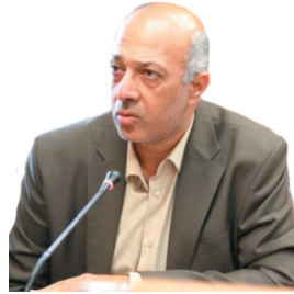
مدیرکل نوسازی، توسعه و تجهیز استان: ۲ هزار کلاس چهارمحال و بختیاری نیازمند سیستم گرمایش استاندارد است