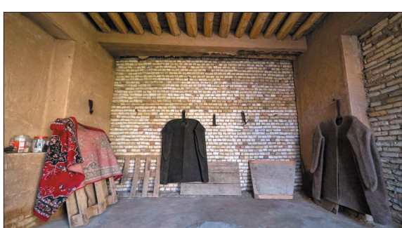
معاون صنایع‌دستی و هنرهای گردشگری و صنایع‌دستی گفت: طرح هر خانه یک کارگاه تولید صنایع‌دستی و هنرهای سنتی می‌شود. به گزارش اداره کل میراث فرهنگی، گردشگری و صنایع‌دستی گفت: طرح هر خانه یک کارگاه تولید صنایع‌دستی و هنرهای سنتی در شهرکرد به‌عنوان آزمایشی اجرایی می‌شود.

جزئیات عرضه ارز از طریق سامانه برخط بازار متشکل ارزی بر اساس بخشنامه بانک مرکزی، همه صرافتی‌های عضو بازار متشکل ارزی از روز ۱۴ آبان موظف به عرضه ارز از طریق سامانه برخط بازار متشکل ارزی شدند. این بانک با صدور بخشنامه ای اعلام کرد: به منظور تسهیل فروش ارز به مردم و جلوگیری از اتلاف وقت متقاضیان خرید ارز و پیرو اطلاعیه های بازار متشکل معاملات ارزی، از روز شنبه مورخ ۱۴۰۱/۰۸/۱۴ صرافتی های عضو بازار متشکل معاملات ارزی، باید متقاضیانی را که از طریق سامانه برخط بازار غیر متشکل معاملات ارزی به نشانی myice.ir معرفی