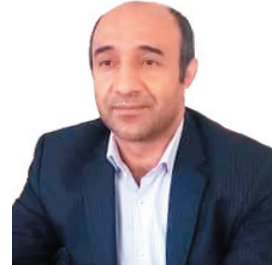
مدیرعامل شرکت آیف چهارمحال و بختیاری: تکمیل تصفیه‌خانه بلداجی ۲۵ میلیارد تومان اعتبار نیاز دارد