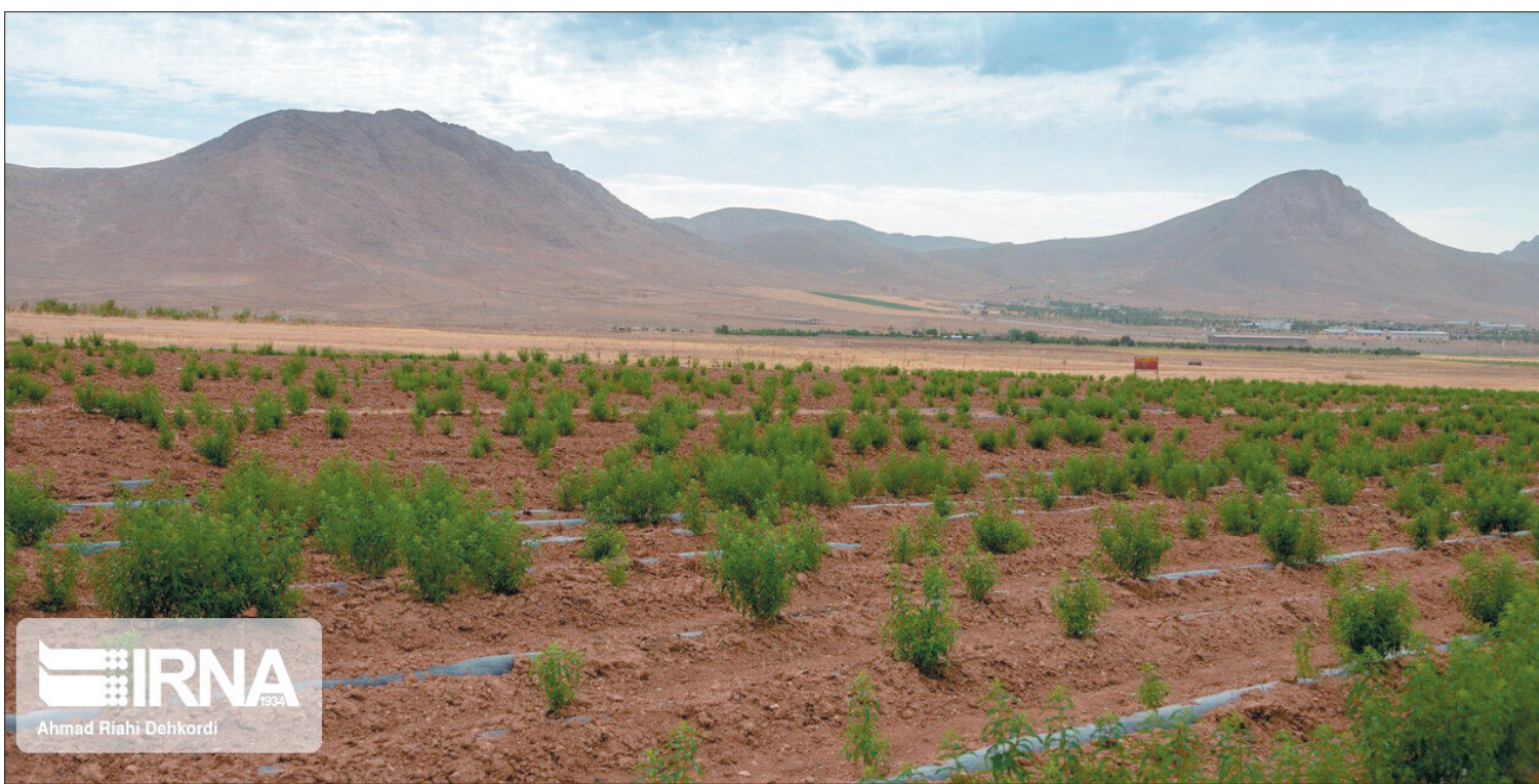
IRNA ۲۰۲۲ Ahmad Riahi Dehkordi