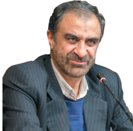
استاندار چهارمحال و بختیاری: گروه‌های جهادی در رفع محرومیت به دولت کمک کنند