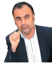
• هوشنگ نوبخت

جنگ رسانه‌ای در زمینه محتواست، نه سکو یا پلتفرم. هرچند دشمن هم کم از راهبردهای فیلتر و تحریم استفاده نمی‌کند؛ نمونه‌اش تحریم پرس‌تی‌وی و فیلتر نام حاج‌قاسم و آرشام و آرتین و ده‌ها نام و اصطلاح دیگر. اما کارویژه اصلی دشمن در زمینه تولید محتواست. مهم‌ترین خاکریز ما برای دفاع هم.