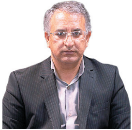
مدیرکل راه و شهرسازی چهارمحال و بختیاری: اختصاص ۳۰۰۰ میلیارد تومان به طرح های راه سازی در چهارمحال و بختیاری