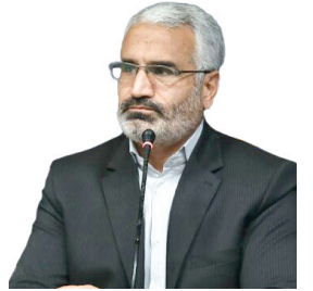
معاون سیاسی، امنیتی و اجتماعی استاندار: برنامه محسوری و آینده نگری در دستور کار ادارات قرار گیرد