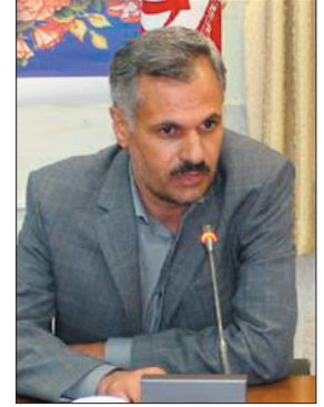
چهارمحال و بختیاری احداث و راه اندازی می شود.

از فعالان این حوزه تعیین تکلیف و سامان دهی می شود و رفاه و آسایش شهروندان هم افزایش می یابد. فرماندار شهر کرد اظهار داشت: تا یک ماه آینده فهرست مناقضیان ثبت نام شده برای دریافت زمین در مجتمع فن آوران شماره ۲ شهر کرد به همراه اطلاعات لازم از سوی اصناف