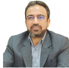
مدیرکل بنیاد مسکن چهارمحال و بختیاری؛ طرح هادی در ۳۷۱ روستا چهارمحال و بختیاری اجرا شده است