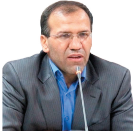
مدیر مخابرات چهارمحال و بختیاری؛ چهارمحال و بختیاری اولین آسانی که فیبر نوری را به روسا کشانده است