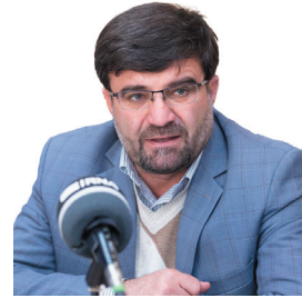
مدیرکل امور عشایر چهارمحال و بختیاری: ۲ هزار پسر خورشیدی بین عشایر چهارمحال و بختیاری توزیع می‌شود