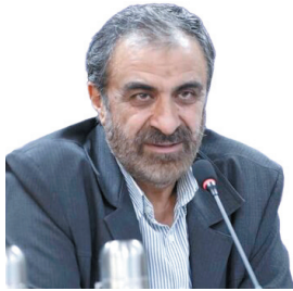
استاندار چهارمحال و بختیاری: فرزندان آوری باید به یک فرهنگ در کشور تبدیل شود