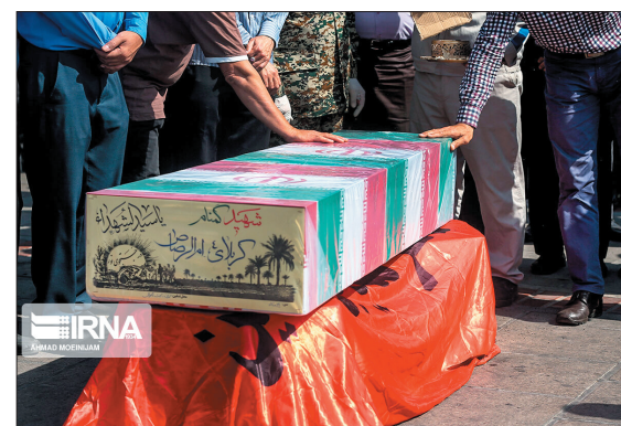
پیکر مطهر یک شهید گمنام روز دوشنبه وارد استان چهارمحال و بختیاری شد که به گفته مسئول روابط عمومی ناحیه بسیج دانشجویی، این استان در هفته جاری میزبان این شهید گمنام است.

چهارمحال و بختیاری در دوران دفاع مقدس بیش از ۲ هزار و ۴۴۰ شهید تقدیم میهن اسلامی ایران کرده است.