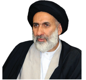
امام جمعه موقت شهرکرد با فریب خوردگان در حوادث اخیر کشور با دیده انصاف نگاه کنیم