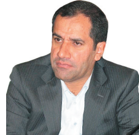
رئیس دانشکده علوم پزشکی شهرکرد استیصال دانشگاه علوم پزشکی شهرکرد از طرح‌های پژوهش محور