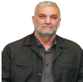
مدیرعامل شرکت گاز چهارمحال و بختیاری صنایع چهارمحال و بختیاری مصرف گاز خود را تا ۵۰ درصد کاهش دهند