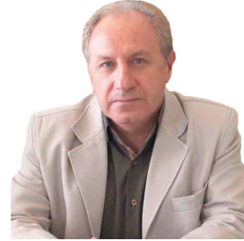
رئیس بنیاد نخبگان چهارمحال و بختیاری با حمایت بنیاد نخبگان، نخبگان به کمک مسائل اولویت دار استان می آیند