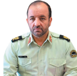
فرمانده انتظامی چهارمحال و بختیاری: قوطی های کمیوت قاچاق در چهارمحال و بختیاری به مقصد نرسیدند