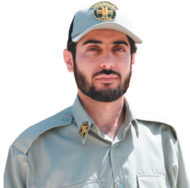
مدیرکل حفاظت محیط‌زیست چهارمحال و بختیاری: جمعیت قوچ و میش مناطق حفاظت‌شده چهارمحال و بختیاری ۴۵ درصد کاهش یافت