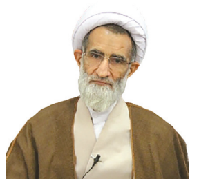
امام جمعه شهرکرد: فتنه‌های دشمن ملت بصیر ایران را از مدار حق خارج نمی‌کند