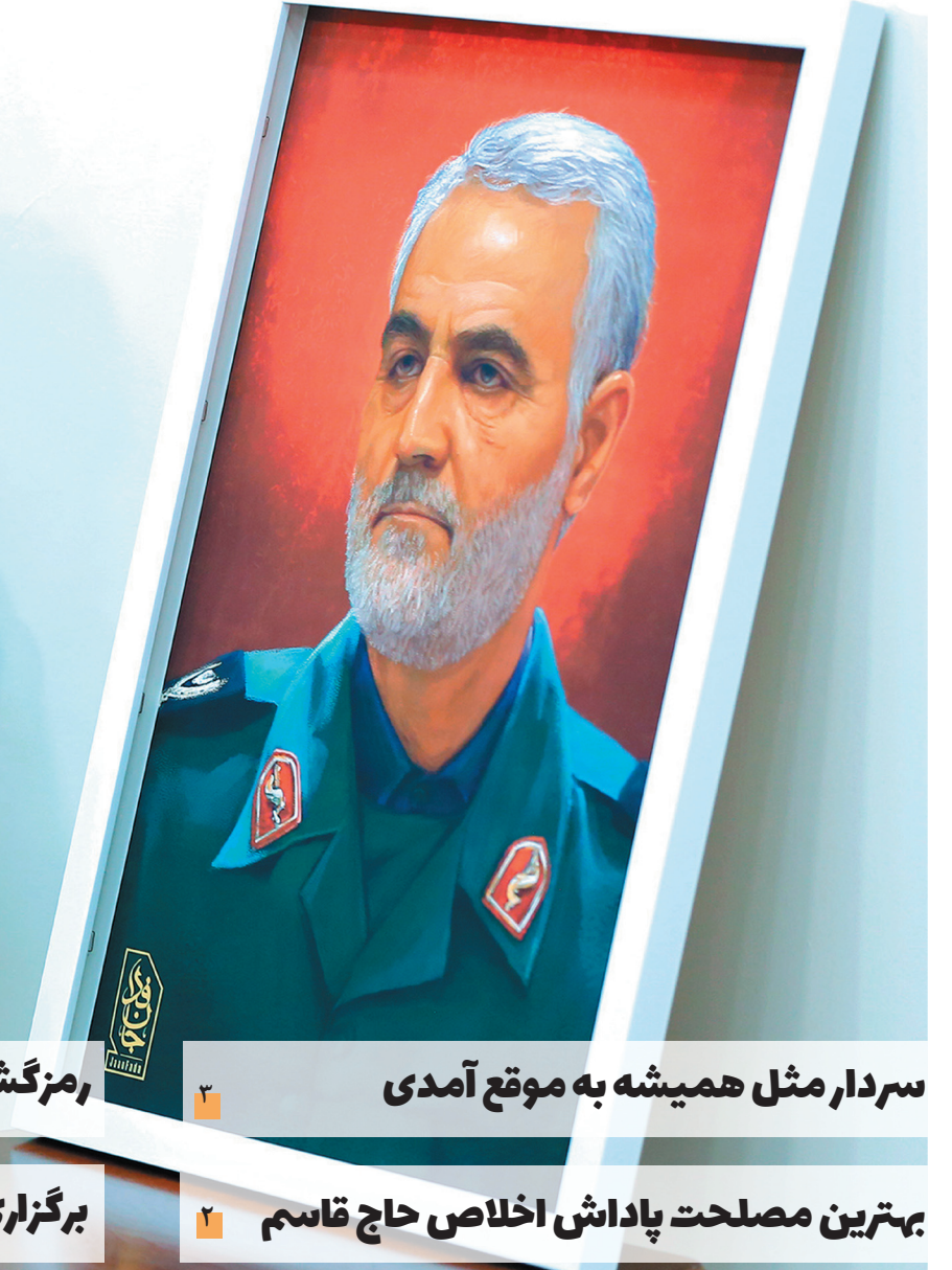
سردار مثل همیشه به موقع آمدی