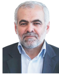
علی یوسف پور

هشت سال جنگ در تمام عملیات های خطر آفرین شجاعانه شرکت کرد، بعد از پایان جنگ لشکر ثارالله به کرمان برگشت، مبارزه با اشرا و برقراری امنیت در مرزهای شرقی کشور، کمک به سازندگی مناطق محروم، مشارکت فعال در عملیات نجات و بازسازی شهر بم که در زلزله مهیب ویران گردید و سال ۱۳۷۹ با حکم مقام معظم رهبری حاج قاسم، فرمانده نیرو قدس سپاه گردید. دوران خدمت به امت اسلامی و مبارزه با استکبار جهانی و اذنباش در منطقه آغاز گردید. منطقه غرب آسیا در طول تاریخ مهمترین منطقه جهان بوده است و همیشه جنگ حق و باطل در این منطقه واقع شده است و در عصر ما هم استکبار با ایجاد رژیم غاصب در کشور فلسطین خود را آماده سرکوب نهضت های اسلامی کرده است با پیروزی انقلاب اسلامی و ایجاد جبهه مقاومت استکبار جهانی قدرت بزرگ و مستتره ای که مسلح به اعتقادات امرای و متکی به مردم منطقه است در مقابل خویش دیده است، طراحي و ایجاد داعش که قرار بود یک دولت با اعتقادات افراطی که شامل عراق- سوریه و لبنان می شود ایجاد گردد و در مرحله ی بعد با تجزیه ایران و سرنگونی نظام جمهوری اسلامی به یک باره سلطه کامل خویش را بر منطقه غرب آسیا کامل کند. پیش از آن عراق