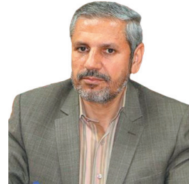
رئیس کل دادگستری چهارمحل و بختیاری: مشخصات مجرمین حرفه ای در سامانه مربوطه ثبت شود