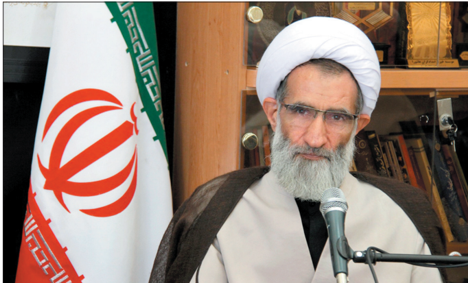
نماینده ولی فقیه در چهارمحال و بختیاری و امام جمعه شهرکرد با اشاره به مصوبات سفر رییس جمهور و هیات دولت به استان

تاکید کرد: موانع عملیاتی شدن این مصوبات از سوی مدیران دستگاههای اجرایی برطرف و برداشته شود. حجت الاسلام و المسلمین محمد علی نگونام در نشست شورای اداری و جلسه معارف مدیران چهارمحال و بختیاری تاکید کرد: در این دولت تلاش های مطلوبی صورت گرفته است و انتظار است که مصوبات رنگ عملیاتی بیشتر به خود بگیرند و موانع پیش روی مصوبات رفع شود. وی با اشاره به ارائه گزارش مدیرکل راه و شهرسازی چهارمحال و بختیاری در خصوص فعالیت انجام شده، اظهار داشت: انتظار است مصوبات هر چه