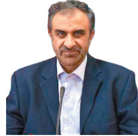
استاندار چهارمحال و بختیاری، بخش خانگی در اولویت تأمین گاز است