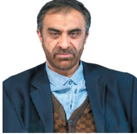
استاندار چهارمحال و بختیاری؛ اعتبار طرح‌های قابل افتتاح دهه فجر در استان ۱۸ هزار میلیارد ریال است