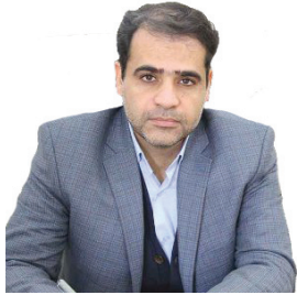
مدیرعامل شرکت توزیع نیروی برق چهارمحال و بختیاری برف ۱۰ میلیارد تومان به شبکه برق رسانی چهارمحال و بختیاری خسارت وارد کرد