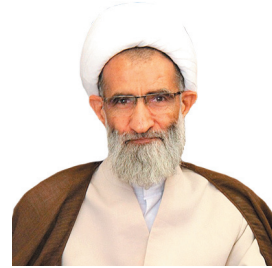
نماینده ولی فقیه در چهارمحال و بختیاری: اعتکاف، اعسال و رفتار انسان‌ها را تخلیص می‌کند