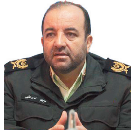
فرمانده انتظامی چهارمحال و بختیاری، ۶۰ تیم به واحد عملیات پلیس چهارمحال و بختیاری افزوده شد / افزایش سرعت عمل پلیس مبارزه با سرقت