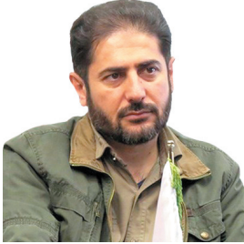
مدیرکل حفاظت محیط‌زیست چهارمحال و بختیاری، علوفه‌رسانی به مناطق حفاظت‌شده محیط‌زیست چهارمحال و بختیاری پس از بارش برف