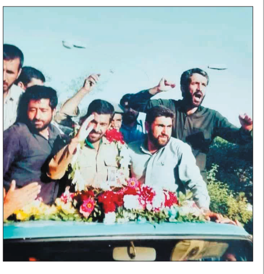
پناه قرآن باشید ...

همکاری سپاه قمر بنی هاشم(ع) استان همزمان با سالروز شهادت امام موسی گفت: شاهد اعزام ۳۲۰ نفر از دانش آموزان استان به کربلای ایران بودیم. وی بیان کرد: این اردوی زیارتی زمینه ای است برای آشنایی نسل جوانمان با کربلای ایران با سرزمینی که خون بهترین فرزندان بر خاک گرم آن ریخته شد، این برنامه ها و این اردوها زمینه ای برای رشد و شکوفایی استعداد های خوب دانش آموزان و آشنایی آنان با سیره شهدا می باشد. امیریان در آخر از همراهی