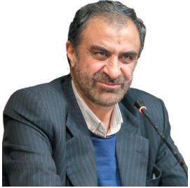
استاندار اعلام کرد: بسیج امکانات ملی در بارش‌های اخیر چهارمحال و بختیاری شکل گرفت