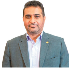
مدیرکل استاندارد چهارمحال و بختیاری: اجرای طرح «بایش کمیت» استاندارد در چهارمحال و بختیاری / ۵۴ پروانه استاندارد باطل شد