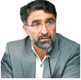
مدیرکل آموزش و پرورش چهارمحال و بختیاری، مدارس چهارمحال و بختیاری برای اسکان مسافران نوروزی مهیا می‌شوند