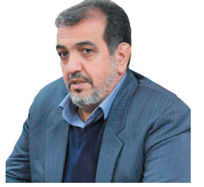
مدیرکل منابع طبیعی و آب‌انرژی‌زایی چهارمحال و بختیاری، غرس ۲۵ سالانه ۲۵ میلیون نهال در چهارمحال و بختیاری