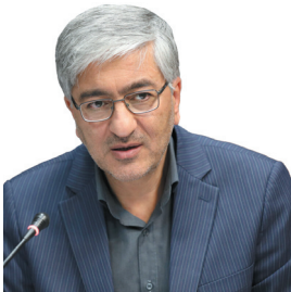
معاونت هماهنگی امور اقتصادی استانداری رفع موانع تولید ۱۰ واحد صنعتی در چهارمحال و بختیاری