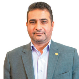
مدیرکل استاندارد چهارمحال و بختیاری محکومیت یک واحد تولیدی مصالح ساختنمایی فاقد پروانه استاندارد در چهارمحال و بختیاری