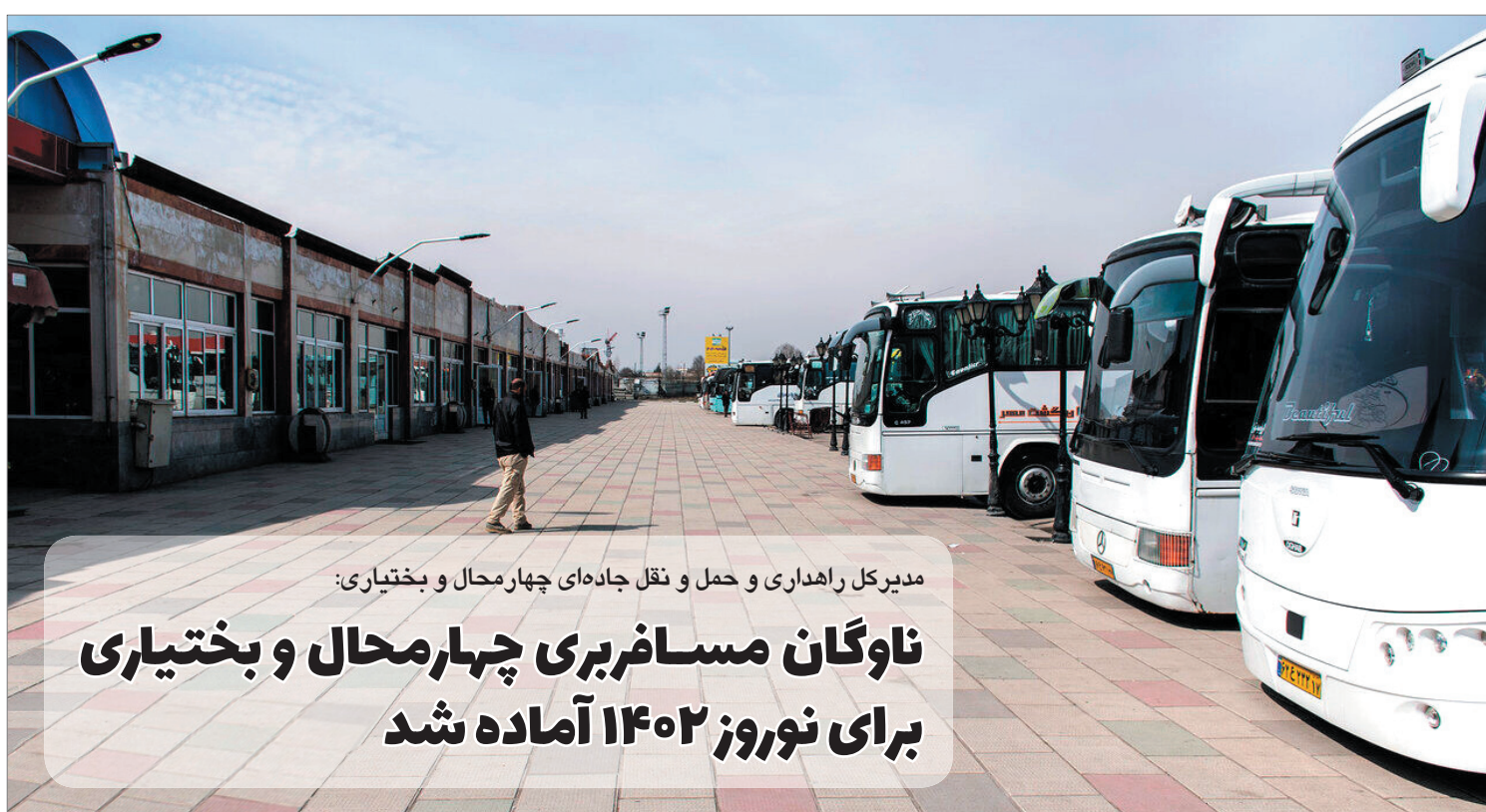
مدیرکل راهداری و حمل و نقل جاده‌ای چهارمحال و بختیاری:

ناوگان مسافربری چهارمحال و بختیاری برای نوروز ۱۴۰۲ آماده شد