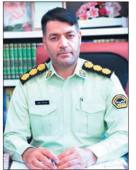
به گزارش خبرگزاری پلیس سرهنگ علی اصغر مهری در رابطه با توصیه های پلیسی برای چهارشنبه آخرسال (چهارشنبه سوری) اظهار داشت: در چهارشنبه آخرسال برخی از افراد بخصوص نوجوانان و جوانان بخاطر رفتارهای غیر

مستولانه سال نو را بر خود و اطرافیان تلخ می نمایند و متأسفانه هر سال در چهارشنبه آخرسال شاهد مجروح شدن تعدادی از شهروندان و گاهی شاهد قطع عضو و حتی از دست رفتن جان افراد هستیم. معاون فرهنگی اجتماعی پلیس استان افزود: امیدواریم با هوشیاری، همکاری و مشارکت همه شهروندان برای امنیت چهارشنبه سوری امسال و توجه به توصیه های زیر، نوروز همراه با سلامتی و سرور و شادی را داشته باشیم. ۱- خانواده ها فرزندان خود را نسبت به عواقب خطرناک بازی با