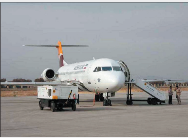
چهارمحال و بختیاری دارای ۱۱ شهرستان با جمعیتی نزدیک به یک میلیون نفر است.

مدیرکل راه و شهرسازی چهارمحال و بختیاری با بیان اینکه فرودگاه شهرکرد یک فرودگاه بین المللی است و ظرفیت پروازهای خارجی را نیز دارد، خاطر نشان کرد: پس از اینکه مجوز افزایش پروازهای داخلی را دریافت کردیم تلاش می شود تا مجوز برای پرواز به کتسور کویت و عتبات عالیات نیز گرفته شود.