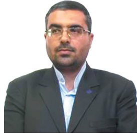
مدیرعامل جمعیت هلال احمر چهارمحال و بختیاری: ۳۲ هزار نفر در بارش‌های اخیر آسیب دیدند/ توزیع هوایی ۲۱ تن اقلام امدادی در چهارمحال و بختیاری