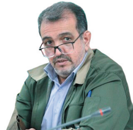
مدیرکل منابع طبیعی و آبخوانداری چهارمحال و بختیاری، ورود گردشگران به دشت لاله‌های وازگون کوهرنگ ممنوع شد