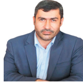
مدیرکل دامپزشکی چهارمحال و بختیاری: تشدید نظارت بهداشتی دامپزشکی تا عید فطر ادامه دارد / ۱۰ تن گوشت مرغ از چرخه مصرف خارج شد