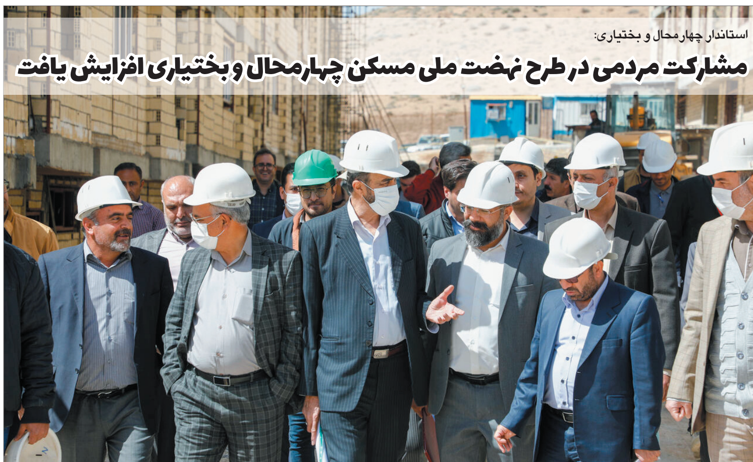
استاندار چهارمحال و بختیاری: