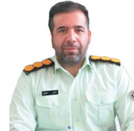
رئیس پلیس فنا چهارمحل و بختیاری: ارتقای سواد رسانه ای ضمن زندگی سالم در فضای مجازی است