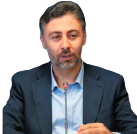
سرپرست سمت چهارمحل و بختیاری: ۴۴۹ طرح صنعتی در چهارمحل و بختیاری مجوز گرفت / احیای واحدهای راگد در اولویت سمت