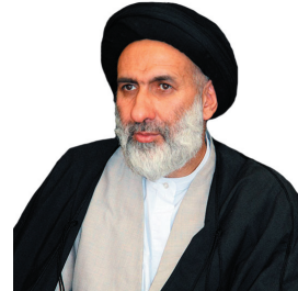
خطیب نماز فطر شهرکرد: مسئولان در حل مشکلات آبی چهارمحال و بختیاری موفق عمل کردند