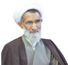
امید آفرینی و راهبرد اصلی مقابله با دشمن است