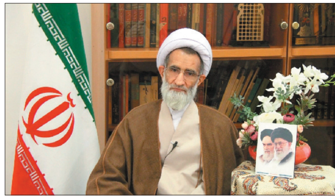
نماینده ولی فقیه در استان چهارمحال و بختیاری گفت: هم افزایی ها بین دولت، کارفرما و کارگران و حتی