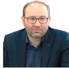
شهردار شهرکرد: صرف ۱۷۲ میلیارد ریال اعتبار برای اجرای پروژه هدایت آبهای سطحی شهرکرد