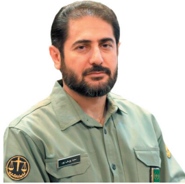
مدیر کل محیط زیست چهارمحال و بختیاری خبرداد افتتاح ۲ خانه محیط زیست در چهارمحال و بختیاری