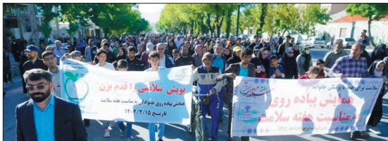
دبیر ستاد برگزاری هفته سلامت در چهارمحال و بختیاری با اشاره به شرکت بیش از سه هزار نفر در این همایش، بیان کرد: این پیاده‌روی از ساعت ۷ صبح و از ستاد دانشگاه علوم پزشکی واقع در خیابان آیت‌الله کاشانی آغاز و به بوستان ملت

وی مطرح کرد: هدف از برگزاری این پیاده‌روی خانوادگی، توسعه فرهنگ سلامت و ورزش، گذراندن یک روز خوب با ورزش و تأثیر آن روی سلامتی روح و جسم افراد است. دبیر ستاد برگزاری هفته سلامت در استان با اشاره به اینکه این همایش به صورت همزمان در شهرستان‌های یازده‌گانه استان برگزار شد، اضافه کرد: بر اساس اعلام اداره کل ورزش و جوانان استان هم‌اکنون ۱۵ درصد جمعیت استان به انجام ورزش مستمر روی آورده‌اند.