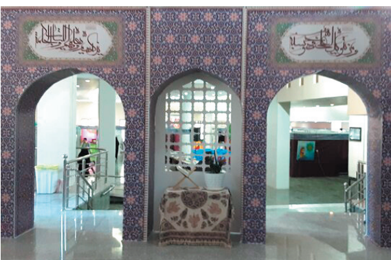
مدیرکل فرهنگ و ارشاد اسلامی چهارمحال و بختیاری افزود: نمایشگاه کتاب، نرم‌افزار و محصولات قرآنی

استان دارای ۳۴ غرفه است و اتفاقات مبارکی در حوزه فرهنگی، نمایشی و موضوعات تربیتی در این نمایشگاه رخ خواهد داد. وی بیان کرد: غرفه‌های عرضه محصولات حجاب و عفاف، فنروش محصولات و کتب قرآنی، انجام مشاوره، پاسخگویی به شبهات دینی، اجرای برنامه‌های فرهنگی و هنری در نمایشگاه کتاب، نرم‌افزار و محصولات قرآنی پیش‌بینی شده است.