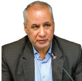
رئیس سازمان مدیریت و برنامه‌ریزی چهارمحال و بختیاری: ابلاغ ۵ هزار و ۹۹۶ میلیارد تومان بودجه عمومی به چهارمحال و بختیاری