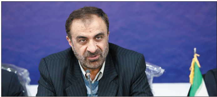
این همایش با تقدیر خانواده تعدادی از شهدای روحانی به نمایندگی از ۸۱ شهید روحانی استان چهارمحال و بختیاری پایان یافت.