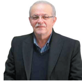
مدیرعامل شرکت آب منطقه‌ای چهارمحال و بختیاری، سد پایاچندر ۸۰ درصد پیشرفت دارد / تلاش می‌وقته برای آبرسانی به ۱۳۶ هزار نفر