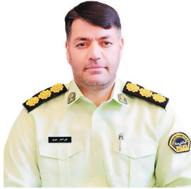
معاون اجتماعی نیروی انتظامی چهارمحال و بختیاری، ۷۳ درصد کلانتری‌های چهارمحال و بختیاری مرکز مشاوره فعال دارند