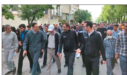
شرکت کنندگان به قید قرعه جوایزی اهدا شد.