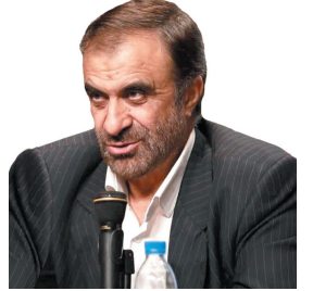
استاد چهارمحل و بختیاری: تداوم کمک مومنانه با توزیع ۵۵۰۰ بسته معیشتی در بام ایران