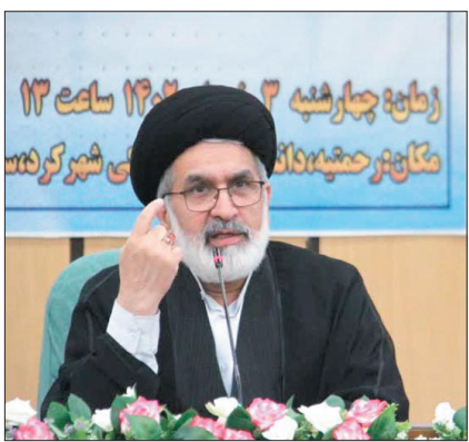
منافات دارد و نباید اتفاق بیفتد، البته باید تأکید کنیم که احساس مسئولیت غیر از دخالت کردن است.

وی افزود: بنای هشت یادمان شهدای گمنام دیگر در چهارمحال و بختیاری تا هفته دولت و هفته دفاع‌مقدس امسال، هشت یادمان با دهه فجر سال جاری و بقیه در سال آینده تکمیل و بهره‌برداری می‌شود.