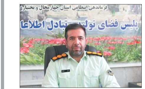
فرماندهی انتظامی استان چهارمحال و بختیاری

وی گفت: از آنجایی که نیروهای مسلح خاصه سپاه و بسیج برای حوادث طبیعی و غیرطبیعی به منظور خدمت رسانی به مردم باید آماده باشند، این رزمایش با بحث زلزله برگزار شد. سردار اکبری خاطر نشان کرد: امداد رسانی و آموزش، ارتقای آمادگی مجموعه های امداد رسان و سنجش آمادگی رده ها و امکانات و تجهیزات از اهداف این رزمایش بود، که بر اساس ارزیابی های انجام شده، با موفقیت اجرا گردید.