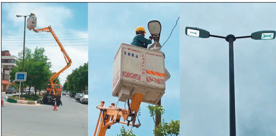
کاهش تولید گازهای گلخانه‌ای و در نهایت کاهش مصرف انرژی

ببینی می‌شود در مدت ۱۵ ماه به اتمام برسد. وی با اشاره به اینکه اجرای کامل این طرح نیاز به ۱۷۰ میلیارد تومان سرمایه‌گذاری دارد، گفت: در این پروژه چراغ‌های ال ای دی کم مصرف که دارای روشنایی بهتری می‌باشد، جایگزین سیستم‌های روشنایی گازی پر مصرف خواهد شد که علاوه بر کاهش مصرف انرژی،