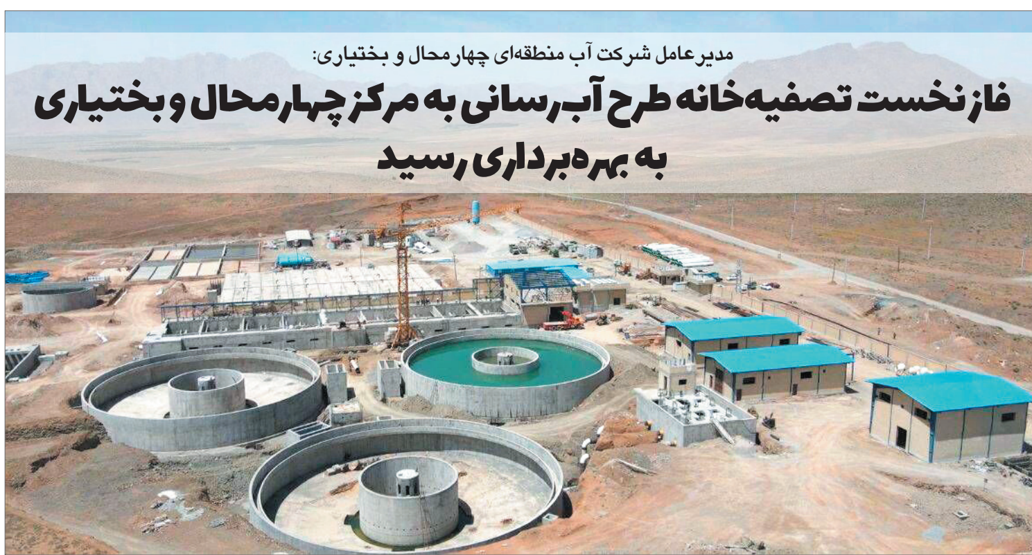
مدیرعامل شرکت آب منطقه‌ای چهارمحال و بختیاری: