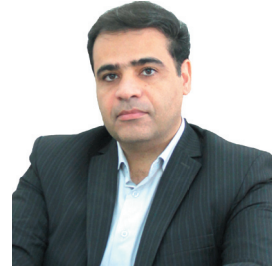
مدیرعامل شرکت توزیع نیروی برق استان اجرای طرح بزرگ جایگزینی ۱۴۰ هزار چراغ روشنایی معابر ال ای دی در چهارمحال و بختیاری