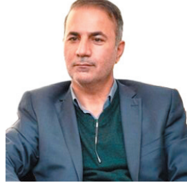
مدیرکل میراث فرهنگی، گردشگری و صنایع دستی استان لژوم افزودن پیوست گردشگری به اقدامات صنعتی و کشاورزی