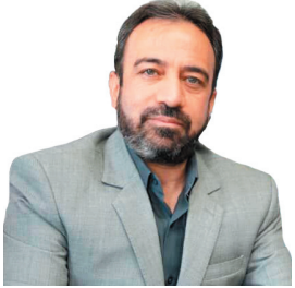
مدیرکل بنیاد مسکن چهارمحال و بختیاری ۵۰۲ متقاضی طرح نهضت ملی مسکن در شهر اردل تأیید نهایی شده‌اند