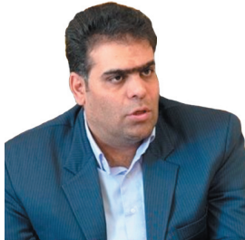
مدیرکل کمیته امداد چهارمحال و بختیاری: ۲۰۰۰ مددجوی چهارمحال و بختیاری خدمات مشاوره حقوقی دریافت کردند