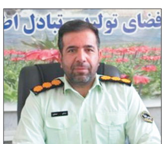
رئیس پلیس فتا چهارمحال و بختیاری گفت: عدم کلیک بر روی هر لینکی، عدم

نکنند، در دام کلاهبردان گرفتار شده‌اند. وی تصریح کرد: توصیه اکید می‌شود اگر شهروندان نمی‌خواهند اتفاقی برای دارایی‌هایشان پیش بیاید همانطور که در فضای حقیقی مراقب سرمایه خود هستند باید در فضای مجازی هم دقت لازم را داشته باشند تا مورد سوءاستفاده قرار نگیرند. رئیس پلیس فتا چهارمحال و بختیاری افزود: مردم به‌هیچ‌عنوان بر روی لینکی که از طریق طریق شماره شخصی