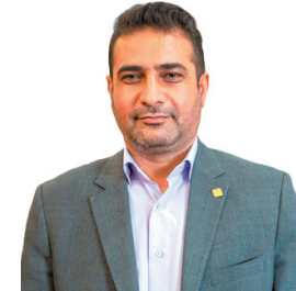
مدیرکل استاندارد چهارمحال و بختیاری: آب شرب در محلات شهر کرد را اعلام کرد