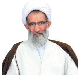
امام جمعه شهرکرد: برنامه‌های غدیر امسال متفاوت از سال‌های قبل باشد