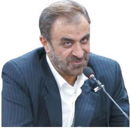
استاندار چهارمحال و بختیاری: ۲۴ درصد اعتبارات سفر رئیس جمهور به چهارمحال و بختیاری تخصیص یافته است