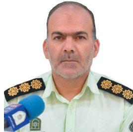
رییس پلیس مبارزه با مواد مخدر چهارمحال و بختیاری: امسال ۸۰۰ کیلوگرم مواد مخدر در چهارمحال و بختیاری کشف و ضبط شد