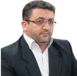
مدیرکل زندان‌های چهارمحال و بختیاری خبر داد: استفاده از ۲۴۶ پابند الکترونیکی برای مجرمان در چهارمحال و بختیاری