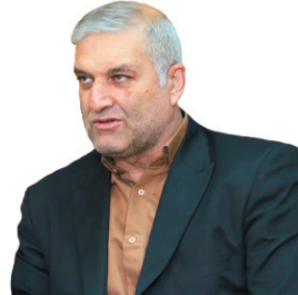
مدیرعامل شرکت گاز چهارمحال و بختیاری، نشت‌یابی بیش از ۲۳۰۰ کیلومتر شبکه گازرسانی در چهارمحال و بختیاری

رئیس جمهور در همایش گرامیداشت هفته قوه قضاییه: