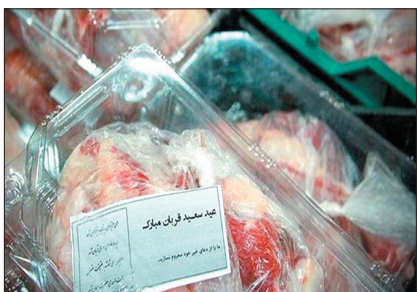
تومسان به صورت نقدی و غیرنقدی در این پویش جمع‌آوری شد.

لرزم بازرسی‌های مداوم و مستمر از تاسیسات گاز تأکید کرد و اظهار داشت: این بازرسی‌ها باعث افزایش ضریب ایمنی، جلوگیری از خطرات احتمالی، کاهش هدر رفت گاز و کاهش آلودگی‌های زیست‌محیطی شده و تأثیر بسزایی در حفظ و صیانت از گاز طبیعی به عنوان یک سرمایه ملی دارد.