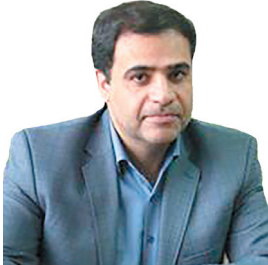
مدیرعامل شرکت توزیع نیروی برق چهارمحال و بختیاری، توزیع ۹۸۵ پل خورشیدی بین عشایر چهارمحال و بختیاری