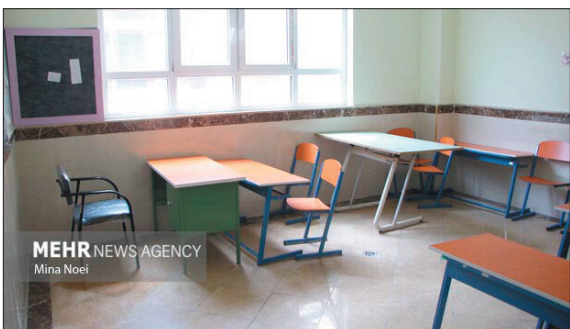
مقطع متوسطه اول شهریه مدارس غیردولتی از ۸ میلیون تا ۱۸ میلیون تومان متغیر است و مقطع متوسطه دوم شهریه بین ۸ تا ۲۱ میلیون تومان تغییر پیدا می‌کند.