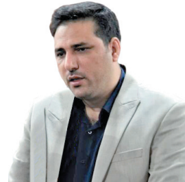
رئیس سازمان چهارمحال و بختیاری استان خبر داد: شناسایی بیش از ۳ هزار تن نهاده دامی بلا تکلیف در چهارمحال و بختیاری