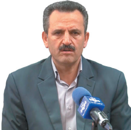
مدیرکل ثبت اسناد و املاک چهارمحال و بختیاری خبر داد: ثبت بیش از ۶ هزار سند ازدواج در چهارمحال و بختیاری