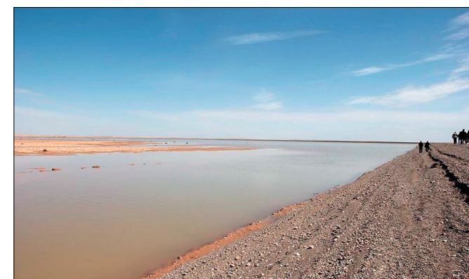
رییس حوضه آبریز رودخانه زاینده رود و حوضه های جنوب غربی فلات گفت: طی چند دهه گذشته ۱۴۰ میلیارد مترمکعب آب از آبخوان ها (آب زیرزمینی) به صورت تجمعی برداشت شده است که این میزان برداشت باعث