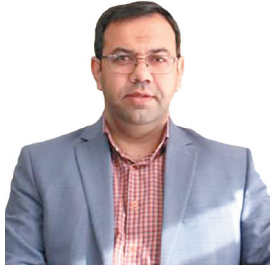
مدیرعامل شرکت شهرکهای صنعتی استان: تعیین تکلیف ۲۴ قطعه زمین را کدر شهرکها و نواحی صنعتی چهارمحال و بختیاری