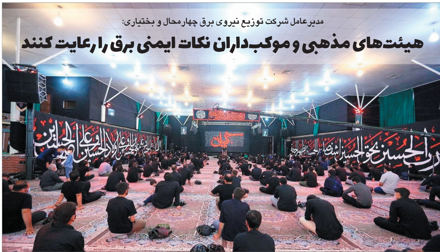
مدیر عامل شرکت توزیع نیروی برق چهارمحال و بختیاری: