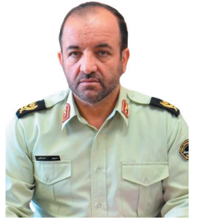
فرمانده انتظامی چهارمحال و بختیاری خبر داد: کشف محموله لوازم جانی موبایل قاچاق در چهارمحال و بختیاری