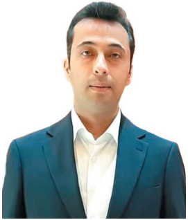
مدیرکل ورزش و جوانان چهارمحال و بختیاری: آمایش سرزمینی مهم‌ترین شاخص در استعدادیابی ورزشی است