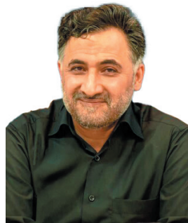
رئیس بنیاد ملی تحکیم کارکردهای بنیاد نجفیان اصلاح است