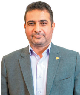
مدیرکل استاندارد چهارمحال و بختیاری: اختصاصی شعبه تخصصی برای رسیدگی به موضوعات استاندارد در چهارمحال و بختیاری