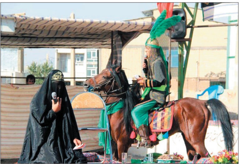
مراسم «تعزیه حضرت قاسم (ع)» در شهر طاقانک

وی ادامه داد: در اساس این باور امام سجاد (ع) نیز از زندان ابن زیاد آزاد شده و در دفن بدن مطهر شهدا یاری رساندند، عده‌ای دیگر نیز بر این باور هستند که واقعه عاشورا و دفن شهدا