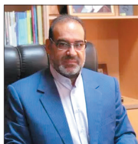
رسیدگی به تعزیرات حکومتی شهرستان بروجن ارسال کردند.

۴ میلیارد و ۲۴۶ میلیون ریال جریمه نقدی محکوم کرد. وی بیان کرد: مأموران پلیس امنیت اقتصادی استان هنگام بازرسی محور مواصلاتی لردگان و بروجن از یک دستگاه خودروی کامیون بازرسی و تعداد ۳۲ دست لنت ترمز ماشین سنگین و ۲ دستگاه ماشین ظرفشویی را به صورت جاساز در زیر بار خرما کشف و توقیف و پرونده را برای