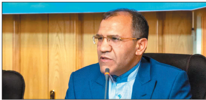
مدیر منطقه مخابرات چهارمحال و بختیاری گفت: مردم مانع از نصب دکل در قسمت‌های پیش‌بینی شده

نخستین بار در استان برای بهره‌مندی در بخش دولتی خریداری شد تصریح کرد: دستگاه تصویربرداری اسپکت سی تی SPECT CT روش غیرتهاجمی و برای تشخیص طیف وسیعی از بیماری‌ها کاربرد دارد. خالدی فر عنوان کرد: این دستگاه برای تشخیص بیماری‌هایی همچون گرفتگی‌های عروق کرونری قلب، بیماری‌های استخوانی، آمبولی ریه، اختلالات غدد تیروئید و پارائتیروئید، انسداد مجاری ادراری و عروق کلیوی در عملکرد کلیه‌ها، اختلالات مغزی و خونریزی دستگاه گوارش مورد استفاده قرار می‌گیرد. وی اذعان داشت: این دستگاه پس از آماده شدن زیرساخت‌ها و فضای فیزیکی مناسب، جهت ارائه خدمات به مردم در شهرکرد نصب و راه اندازی می‌شود.