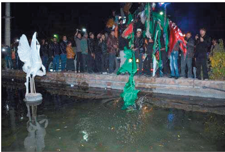
آیین «علم‌زنی به چشمه آب» در شهر بن

امروز جبهه فرهنگی کشور نیازمند حضور نسل جوانی است که به واسطه همین آداب و رسوم خاص شهرها در عزاداری‌های محرم، به هیات و دسته‌های عزاداری می‌پیوندند. اینگونه است که می‌توان حماسه عاشورا را در تاریخ جاودانه کرد.