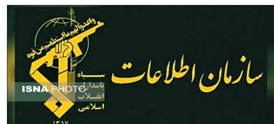
در مورخ ۱۴۰۲/۰۲/۲۷ سرابازان گمنام آقا امام زمان عجل الله

عناصر جریان انحرافی که قصد اقدامات تبلیغی و هتاکی به مقدسات در ایام محرم در چهارمحال و بختیاری را داشتند، متلاشی شدند.