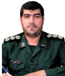
مؤیدکل بنیاد حفظ آثار و نشر ارزش‌های دفاع مقدس: تکمیل تمام یادمان‌های شهیدای گمنام چهارمحال و بختیاری تا پایان سال ۱۴۰۳