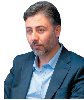
سرپرست سمت چهارمحال و بختیاری: یک قدم تا بهره‌داری از طرح تولید شمن منیزیم در چهارمحال و بختیاری