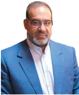
مدیرکل تعزیرات حکومتی چهارمحال و بختیاری ۲۱ پرونده تعزیرات برای واحدهای صنعتی در چهارمحال و بختیاری تشکیل شد