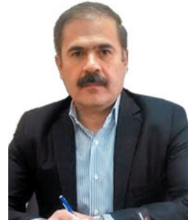
مدیرکل ارتباطات و فناوری اطلاعات چهارمحال و بختیاری، ۲۷۰ میلیارد ریال اعتبار ملی برای اجرای فیر نوری در شهرستان لردگان تأمین شد