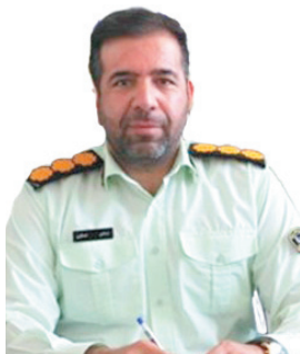
رئیس پلیس فتا چهارمحال و بختیاری، ۶۰ درصد پرونده‌های پلیس فتا در چهارمحال و بختیاری مربوط به جرائم مالی است